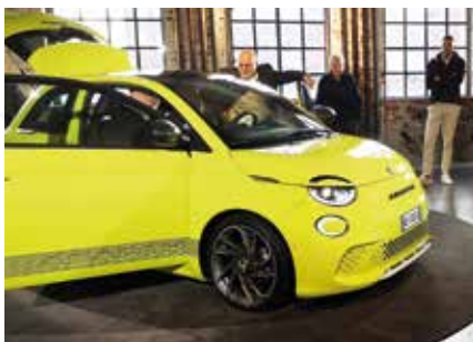
MEINUNG More Abarth