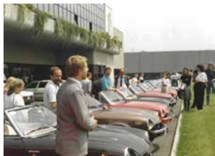
RÜCKBLICK 40 Jahre Club